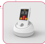
Portable alarm ontvanger